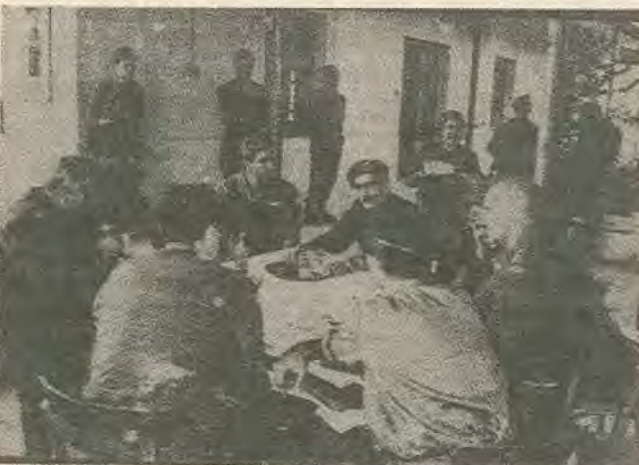
Ο Γρίβας και οι αξιωματικοί που πίνουν τον καφέ τους στο σταθμό Σκαρίνου μετά τις σφαγές της Κοφίνου.

«Το πρώτο που θέλουμε να υπογραμμίσουμε είναι το ότι η